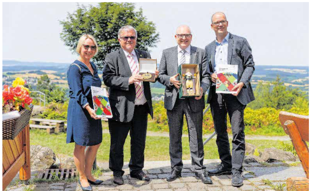
weiter auf Seite 3

Sowohl der Unesco-Welterbe-Titel Montanregion Erzgebirge/Krusnohorí als auch der Titel der Kulturhauptstadt Europas 2025 bieten zahlreiche Anknüpfungspunkte zur Ausgestaltung der Kooperationsvereinbarung. Langfristig verfolgen beide Partner das Ziel, sich als grenzenlose Region in der Mitte Europas mit einer gelebten Weiterempfehlungskultur erfolgreich zu etablieren. ■