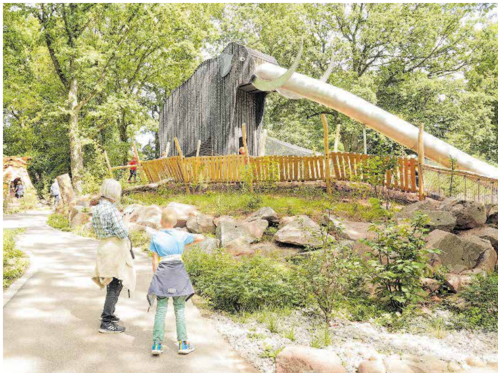
Mit dem Eiszeitspielplatz hat der Tierpark nun auch mitten in seinem Herzen eine Spielanlage für seine kleinen Besucherinnen und Besucher.

Über den Spielplatz führen Tierspuren verschiedener Eiszeittiere sowie nachgebildete Gletscherschrammen zu kleinen Schildern mit Informationen zum Leben in der Eiszeit. Neben einem einleitenden Satz führen QR-Codes Interessierte dann auf eine Website des Museums für Naturkunde Chemnitz. »Wir wollten keinen Schilderwald mit verschulden Informationen, sondern ein moder-