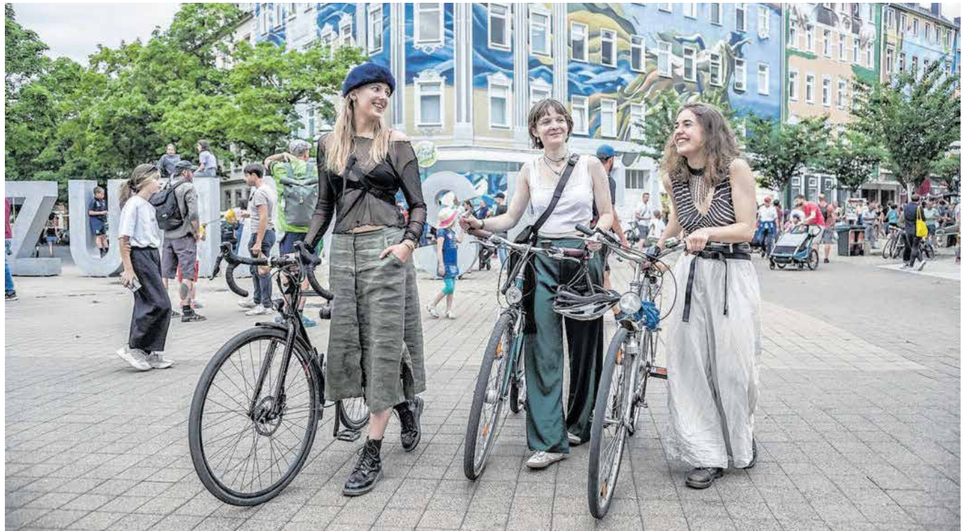
Zum Kosmos-Festival am 17. Juni waren alle Events auch mit dem Fahrrad gut zu erreichen.

Der aktuelle Modal Split für Chemnitz – also die Aufteilung der Wege, die in der Stadt auf den verschiedenen Verkehrsträgern zurückgelegt werden – zeigt einen Radverkehrs-