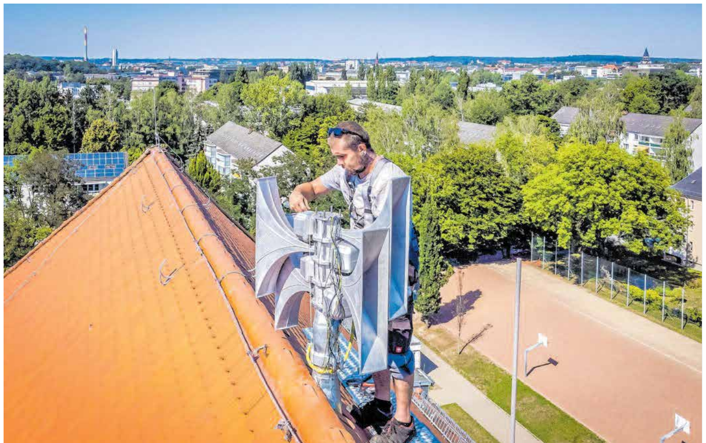
Die neuinstallierte Sirene auf dem Dach der Comenius-Grundschule ist eine von elf zusätzlichen elektronischen Sirenen, die künftig die Bevölkerung der Stadt warnen werden.

Zum System gehört darüber hinaus ein digitaler Sirenensteuerempfänger, damit die Integrierte Regional-