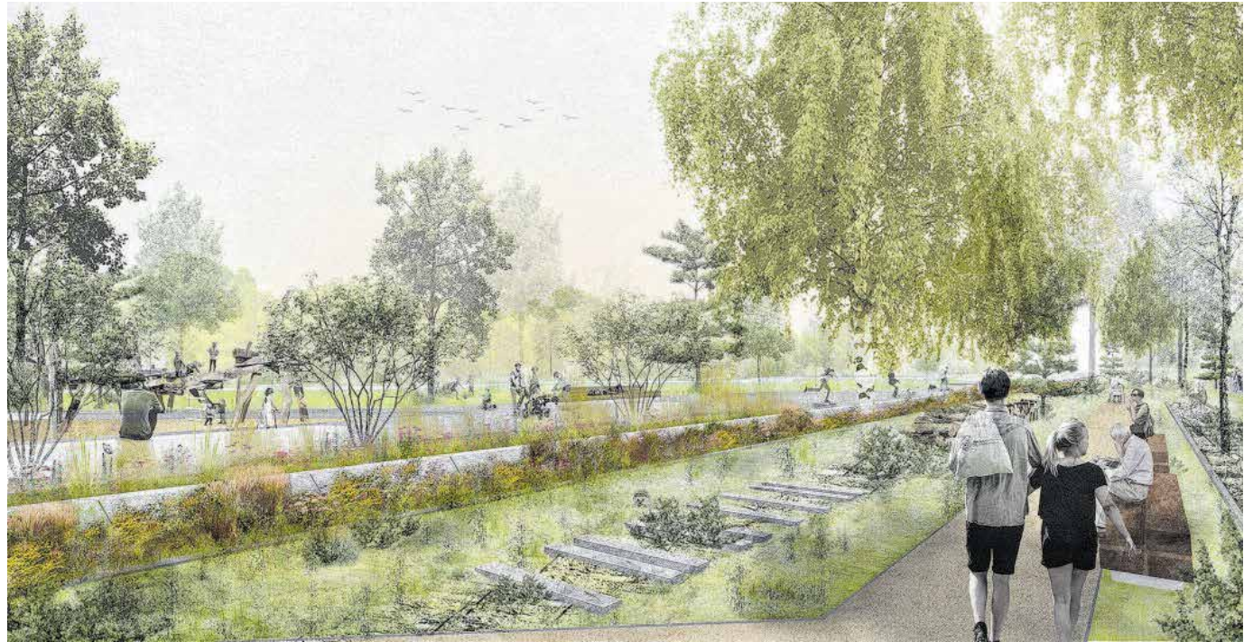
Entlang der gesamten ehemaligen Gleistrasse von der Rudolf-Krahl-Straße bis zur ehemalige Erzbergerstraße werden historische Bahnrelikte wie Prellböcke, Stellschienen, Kilometersteine oder Masten erhalten, wenn nötig restauriert und in den Grünzug integriert. Visualisierung: Büro Station C23

Im Zuge der Gewässerplanung soll der Pleißenbach im ersten Bauabschnitt auf Höhe der Brachfläche und eines alten Teiches aufgeweitet, Nebenarme gebildet und der nördlich ankommende Mühlgraben offengelegt werden. Der im westlichen Bereich befindliche Baumbestand bildet neben dem neu entstehenden Bach das Grundgerüst der neuen Anlage und wird größtenteils erhalten. In Nähe des künftigen Radweges werden