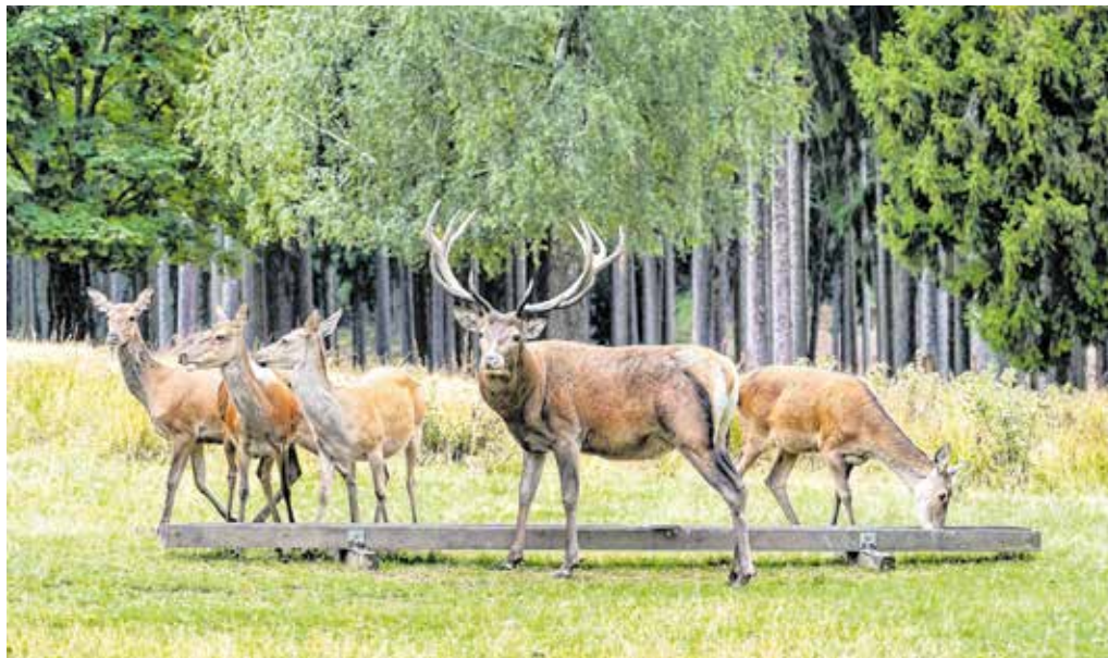
Die heimische Tier- und Pflanzenwelt wird bei einem Besuch im Wildgatter Oberrabenstein näher betrachtet.

Getreu dem Semester motto »Ganzheitlich lernen« hat die Volkshochschule ihr neues Programm sehr vielfältig gestaltet. Neben Vorträgen zu aktuellen und relevanten gesellschaftlichen Themen locken Kunstexkursionen, Fremdsprachenkurse und vieles mehr. Besonderer Fokus liegt im kommenden Semester auf dem Thema ökologische Nachhaltigkeit. Hervorzuheben ist hierbei die neue Reihe zur Rohstoff- und Versorgungssicherheit. In deren Ver-