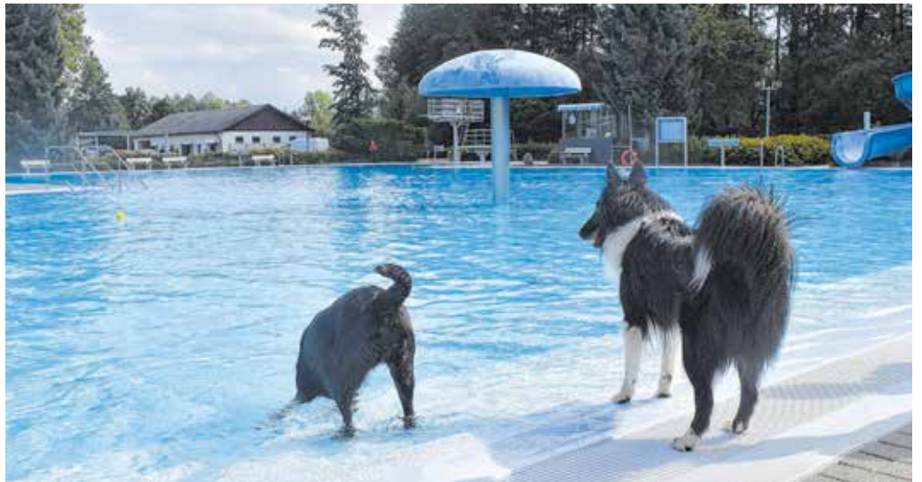
Zum Abschluss der Freibadsaison lädt das Freibad Wittgensdorf Vierbeiner mit Begleitung am 11. September wieder zum beliebten Pfötchenschwimmen ein.

Und am 18. September, von 10 bis 16 Uhr ist im Freibad Gablenz großer Modellbautag für fahrtüchtige Modelle zu Wasser und zu Land (Boote, Segelschiffe, U-Boote, Bagger, Transportfahrzeuge, Geländefahrzeuge etc.). Eintritt 1 Euro, Modellbauerinnen und -bauer mit Begleitung haben freien Eintritt.