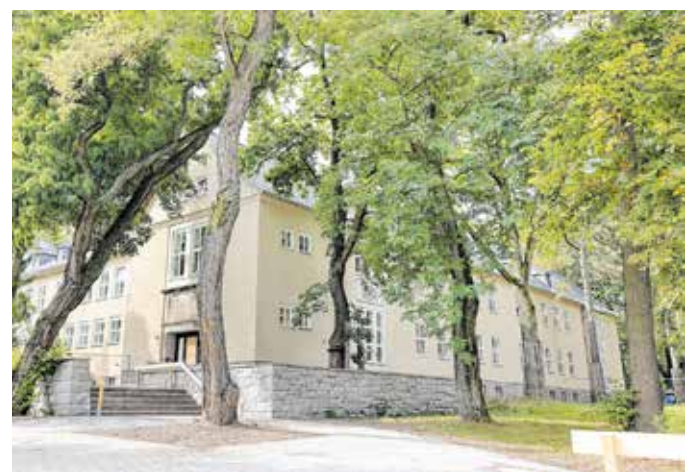
Am Mittwoch wurde der erste Teil der neuen Grundschule Weststraße/Ecke Reichsstraße in Betrieb genommen.