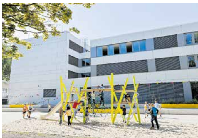
Pünktlich zum Schuljahresbeginn nahmen die Schülerinnen und Schüler »ihre« neue Schule in Besitz.