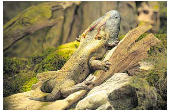
Der Chemnitzer Dachschildlurch Chemnitzion richteri ist noch bis zum 4. Oktober zu sehen. Das Museum für Naturkunde hat die Ausstellung wegen des großen Besucherinteresses verlängert. Am 6. September kann dem »lebenden« Fossil mit VR-Brille direkt in die Augen gesehen werden.