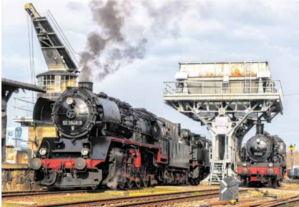
Der Schauplatz Eisenbahn in Hilbersdorf ist eine von vielen Stationen zum Tag des offenen Denkmals am 11. September.