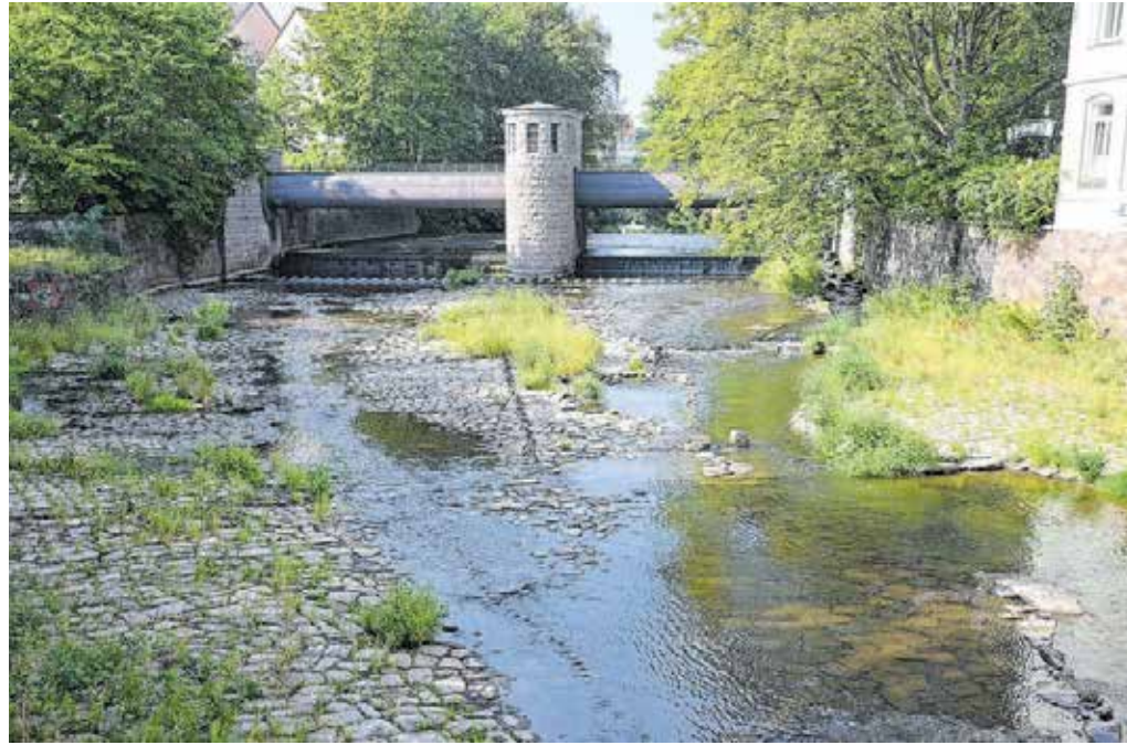
Die Chemnitz am Wehr an der Georgbrücke im August diesen Jahres. Hitze und ausbleibende Niederschläge minimieren die Pegelstände der Flüsse. Die Untere Wasserbehörde musste im Sommer mit einer Allgemeinverfügung die Wasserentnahme aus oberirdischen Gewässern untersagen.

Schaut man sich den Verlauf der Durchschnittstemperatur für Deutschland zwischen 1881 und 2021 an, ist die fortschreitende Erwärmung (s. Abb. Temperaturstreifen) deutlich abzulesen. Jedes Jahr changiert – je nach Temperaturabweichung vom Durchschnittswert – von dunkelblau (sehr kühl) über hellblau und hellrot bis dunkelrot (sehr heiß).