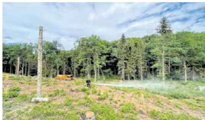
Mit Mischwald wird derzeit das Waldgebiet Sechsruthen aufgeforstet. Durch den Borkenkäferbefall sind hier größere Lichtungen entstanden. Die Neupflanzungen werden reichlich bewässert. Foto: Stadt Chemnitz

Quelle: Deutscher Wetterdienst DWD, Climate Data Center (CDC)