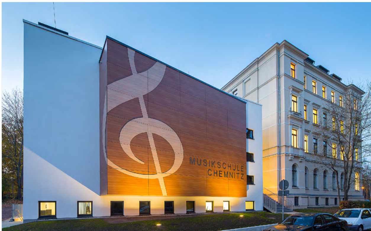
Die Gebühren der Städtischen Musikschule werden ab 1. August 2023 angepasst. Geplant war die Anhebung bereits für 2021/22. Wegen der Corona-Pandemie wurde damals jedoch darauf verzichtet.

Der Stadtrat hat in seiner Sitzung beschlossen, die Scheffelstraße zwischen Kauffahrtei und Dittersdorfer Straße grundhaft zu sanieren. Der alte und zum Teil schadhafte Belag wird entfernt und eine neue Asphaltdecke aufgetragen. Auch werden die