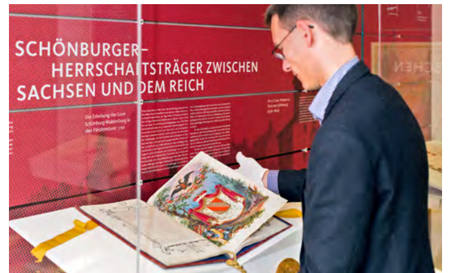
Das Staatsarchiv zeigt »Die Schönburger – Herrschaftsträger zwischen Sachsen und dem Reich«.

landschaft, deren Bestände und musealen Aufgaben unter neuen Blickwinkeln zu entdecken und sich von der Vielfalt der Themen, künstlerischen Ausdrucksformen, historisch-technischen Meisterleistungen und den neuesten digitalen Möglichkeiten der Vermittlungsarbeit überraschen zu lassen. Die Vielzahl kultureller Einrichtungen, die Dichte der Chemnitzer Museumslandschaft und deren thematische Vielfalt zeugen von einer lebendigen und wachsenden Kulturlandschaft.