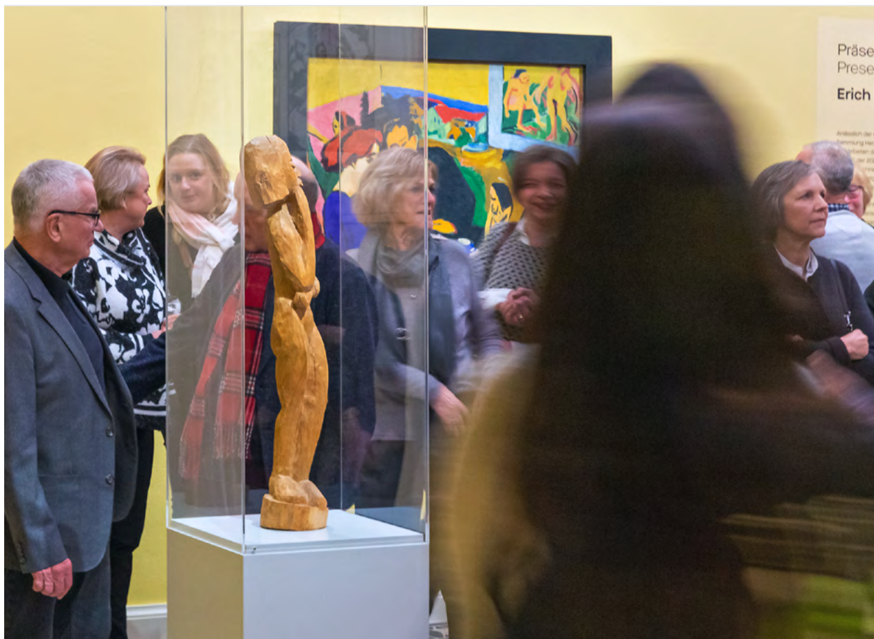
Die Kunstsammlungen am Theaterplatz freuen sich auf zahlreiche Gäste zur Museumsnacht.

Verschiedene Kurzführungen gewähren ungewöhnliche Einblicke und regen zum Perspektivwechsel an! Es gibt nicht nur Führungen durch die Dauer- und Sonderausstellungen, sondern auch Interessantes zum Werk von Carlfriedrich Claus, einen Blick hinter die Kulissen in die Bibliothek und das Archiv der Kunst-