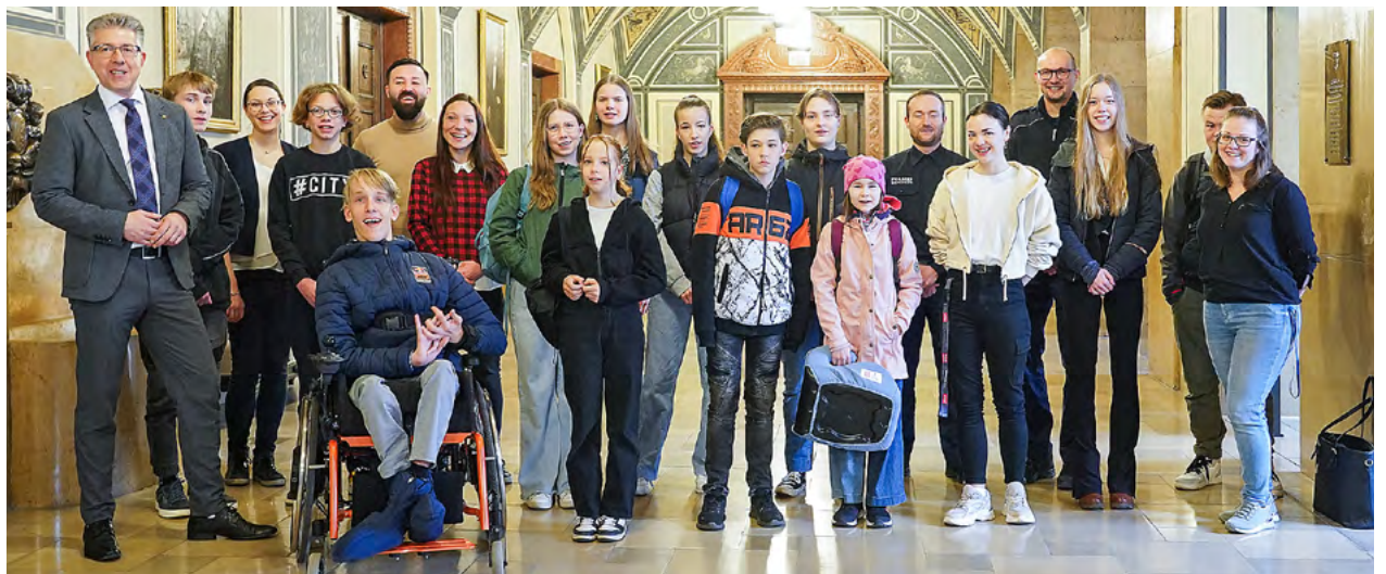
Zum Girls' und Boys'Day besuchten 25 Schülerinnen und 12 Schüler die Stadt Chemnitz.

Die Einsatzorte für die Mädchen waren vielfältig: in der Stadtbibliothek, im Stadtbad, im Botanischen Garten, im Fuhrparkmanagement, bei der Verkehrsüberwachung und der mobilen Geschwindigkeitsüberwachung, in der Leitstelle des Ordnungsamtes und im IT-Bereich konnten sie Erfahrungen sammeln.