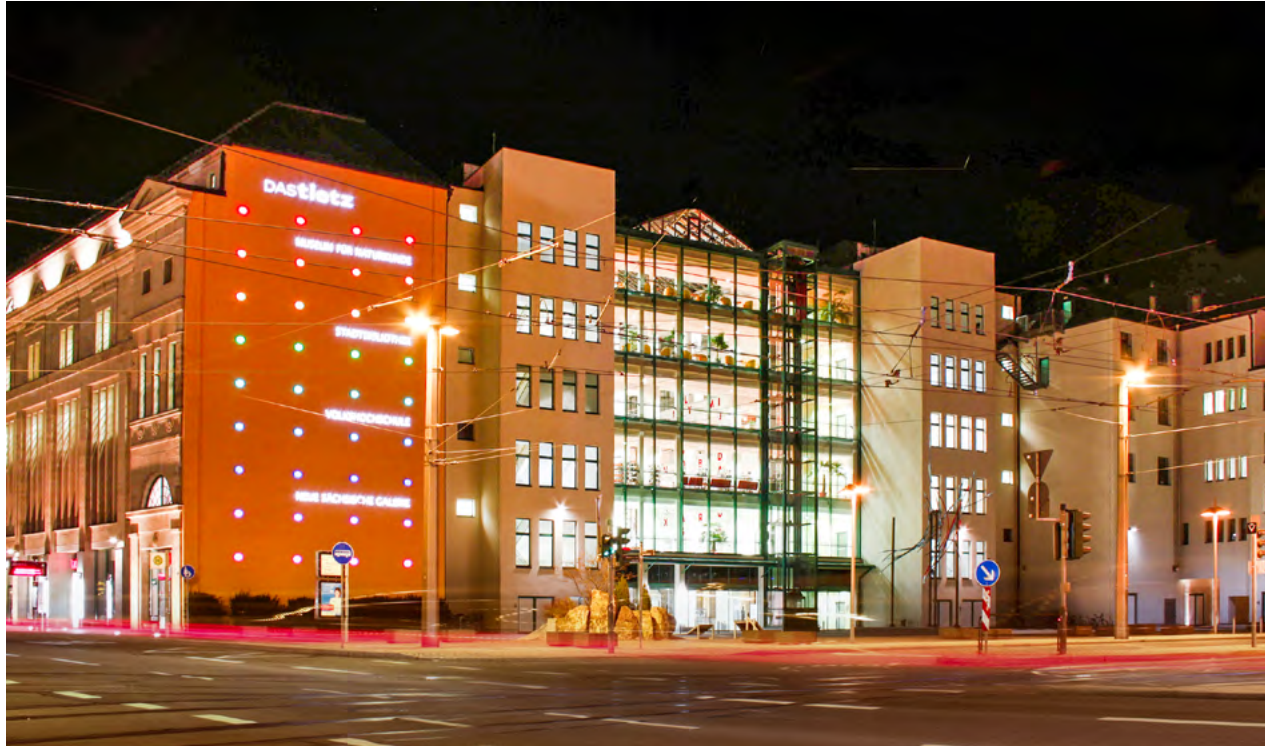
Auf dem Tietz-Vorplatz beginnt die Museumsnacht 2023 am 13. Mai um 17.30 Uhr mit einer Auftaktveranstaltung. Musikalische Acts, Workshops sowie eine Videoprojektion erwarten bis Mitternacht alle Gäste kostenfrei.

Die Besucherinnen und Besucher sind eingeladen, die Chemnitzer Museums-