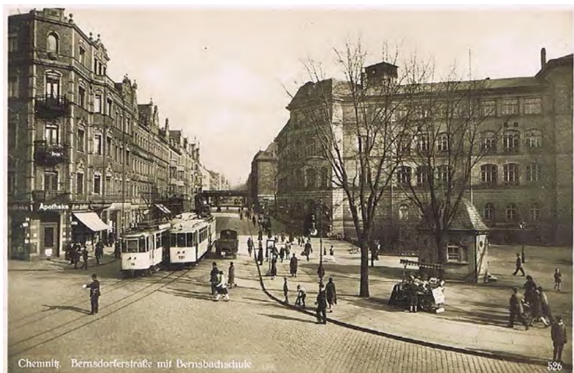
In diesem Bild aus dem Jahr 1929 ist auf der linken Seite die damalige Rosen-Apotheke zu sehen.