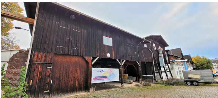
Das Gelände der Stadtwirtschaft befindet sich an der Jakobstraße.

der Stadt und privatem Engagement – einen unverzichtbaren Beitrag zur Stadtentwicklung. Dazu flossen bisher mehr als 400 Mio. Euro Zuschüsse aus verschiedenen Programmen in Fördergebiete der Gründerzeit, in die Innenstadt, in Stadtteile im Heckert-Gebiet oder zur Revitalisierung von Brachen. Quartiermanagements sind im Auftrag des Stadtplanungsamtes vor Ort mit Bürgern aktiv, Sanierungsträger und Agenturen beraten Gebäudeeigentümer und neue Investoren, regen zu kooperativen Wohnprojekten an und unterstützen kleine Unternehmen im Quartier. In der Regel tragen Bund, Land und die Stadt Chemnitz etwa jeweils ein Drittel der Kosten bei solchen Vorhaben. Städtebauförderung setzt Impulse für weitere öffentliche und private Initiativen: 1 Euro Städtebauförderung generiert etwa 7 Euro Folgeinvestitionen. Der Tag der Städtebauförderung wird bundesweit seit 2015 begangen, um Bürgerbeteiligung in der Stadtentwicklung zu stärken und Erfolge der Städtebauförderung sichtbar zu machen. ■ chemnitz.de/staedtebaufoerderung