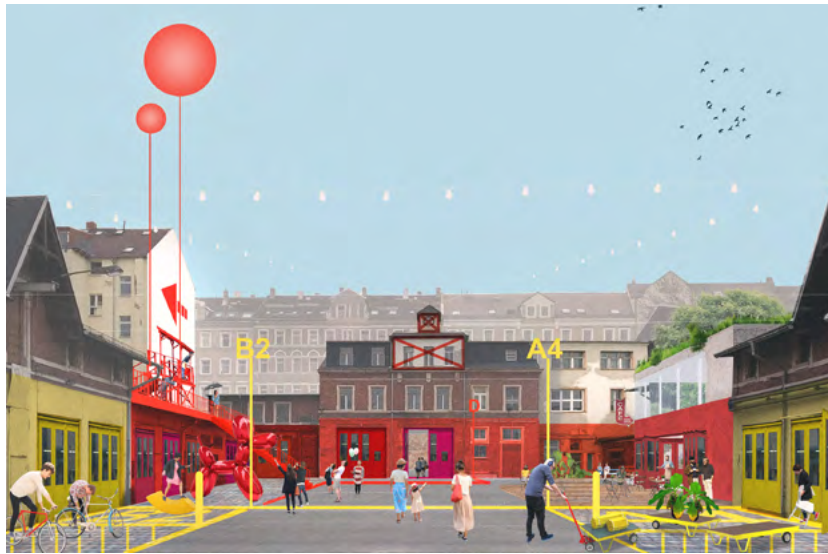
Die Stadtwirtschaft soll sich zu einem Ort für Kreativität entwickeln. Grafik: Stadtplanungsamt

Um 10 und 15 Uhr sind Führungen über das Gelände der Stadtwirtschaft (Jakobstraße 46) geplant, die jeweils etwa anderthalb Stunden dauern. Vertreterinnen und Vertreter des Stadtplanungsamts der Stadt Chemnitz informieren mit den Umsetzungspartnern Kreatives Chemnitz e. V. und anderen Akteuren über den Stand der Sanierungsarbeiten und über bereits vorhandene und künftige Angebote. Für Imbiss und Getränke ist gesorgt. Um 12 Uhr startet von dort eine Tour über den Sonnenberg, die weitere Projekte der Städtebauförderung wie die Kreativachse Chemnitz vorstellt. Auf dem Gelände der ehemaligen Dünger-Abfuhr-Gesellschaft, die ab 1891 im