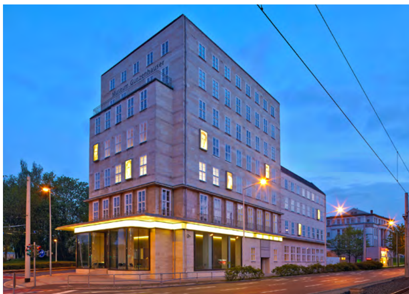
Das Museum Gunzenhauser ist wie die Kunstsammlungen am Theaterplatz, das Schloßbergmuseum, das Henry van de Velde Museum und die Burg Rabenstein zur Museumsnacht nach Anbruch der Dunkelheit zu erleben.

sammlungen am Theaterplatz oder eine Lesung zu »Sagen und Historien« mit dem Klosterbruder Bibliothecarius. Außerdem haben Besucherinnen und Besucher im Schloßbergmuseum die Möglichkeit, einer Restauratorin bei ihrer Arbeit an mittelalterlichen Schnitzfiguren über die Schulter zu schauen. Im Museum Gunzenhauser können sie unter anderem den Tresorraum besichtigen. Eine besondere Empfehlung ist die letzte Führung des Hauses: »Visitor's Choice« um Mitternacht. Dabei entscheiden die Gäste selbst, zu welchen Werken sie geführt werden möchten.