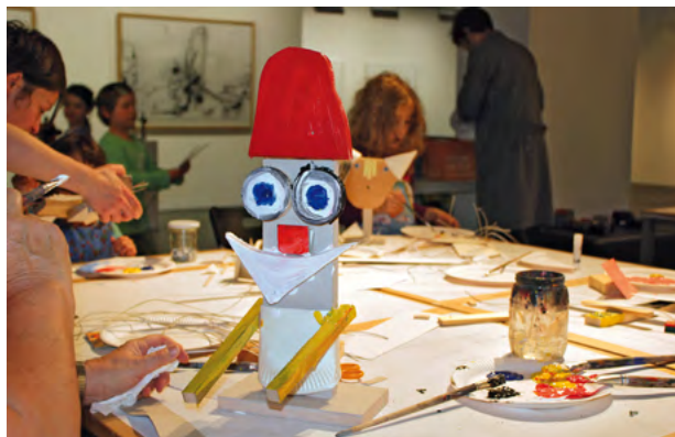
In der Neuen Sächsischen Galerie können sich kleine und große Künstlerinnen und Künstler ausprobieren.