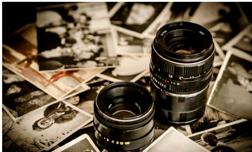
Der Fachbereich Kunst und Kultur widmet sich im neuen Wintersemester in besonderem Maße der Fotografie. Eine Vielfalt an Kursangeboten nimmt die mannigfaltigen Techniken und Motive in den Fokus. Das Spektrum reicht von analoger bis zu Handy-Fotografie.

In dem knappen und gängigen Ausdruck »gut zu wissen« steckt der gesamte Ansatz der Volkshochschularbeit. Lernen ist nicht nur Selbstzweck. Die Aneignung von Wissen und Fertigkeiten wird erst durch deren Nutzen wertvoll. Durch Lernen werden Horizonte erweitert, Perspektiven eröffnet, Zusammenhänge offenbart und Impulse gegeben. Lernen ist auch immer eine Herausforderung, Schwellen zu überwinden und die Chance, an Aufgaben und Übungen zu wachsen. All das macht Wissen gut. In diesem Sinne arbeitet die Volkshochschule Chemnitz ständig daran, ein interessantes, vielfältiges und aktuell relevantes Kursprogramm zu bieten.