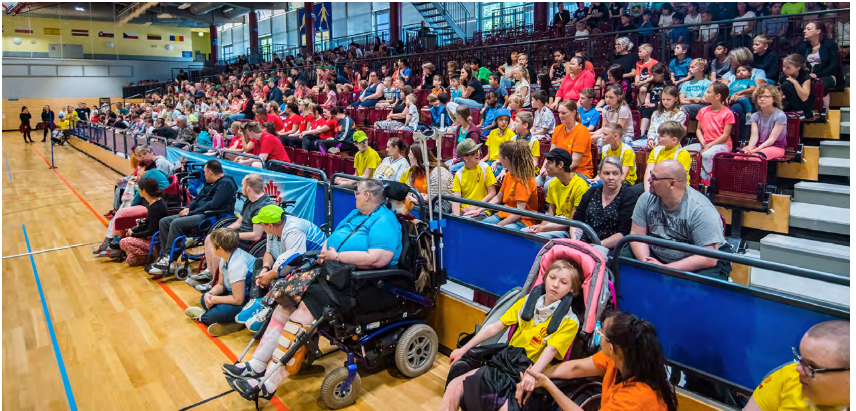
Beim »Fest der bewegenden Begegnung« bot sich die Möglichkeit, bei gemeinsamen sportlichen Aktivitäten die litauischen Gäste kennenzulernen.