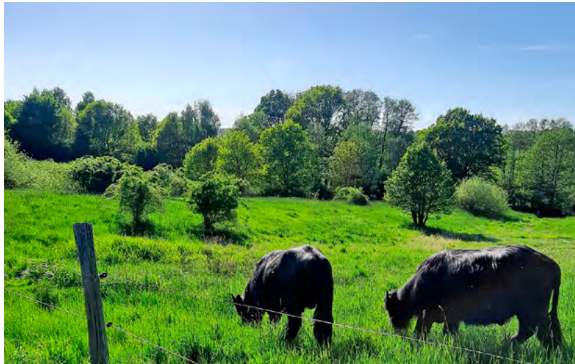
Wasserbüffel helfen bei der Landschaftspflege durch eine schonende Beweidung. So funktionieren Landschaftspflege und Naturschutz.

Beweidung mit Wasserbüffeln in Chemnitz? Manche kennen den Wasserbüffel aus dem asiatischen Raum, wo sie zum Pflügen der Reisfelder eingesetzt werden. Hier werden Wasserbüffel selten, aber aufgrund ihrer Klauenstellung vornehmlich zur Biotoppflege von Feucht- und Sumpfständen eingesetzt. Die Exkursion soll zeigen, wie sich Landschaftspflege durch extensive, naturschonende Beweidung positiv auf den Gebietscharakter auswirkt. Auch wird aufgezeigt, wie Landwirtschaft und Naturschutz miteinander funktionieren. Landwirt Tim Winkler und die Untere Naturschutzbehörde Chemnitz werden jeweils aus ihrer Sicht berichten