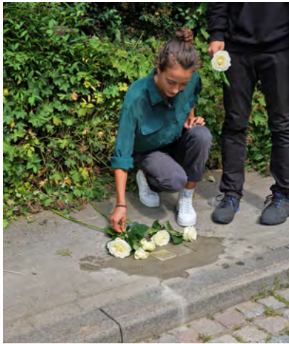
An elf Orten gedachten viele Menschen denjenigen, die von den Nationalsozialisten verfolgt und ermordet wurden.