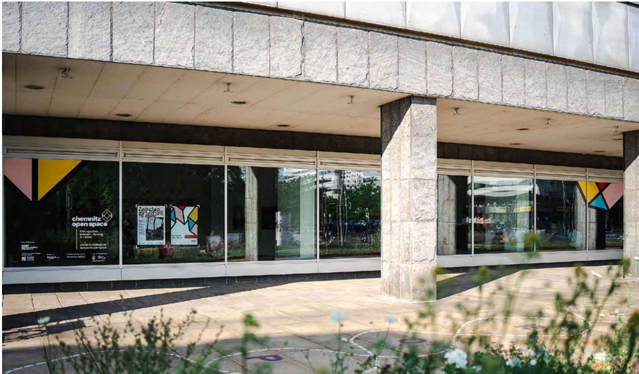
Der Chemnitz Open Space befindet sich direkt im Gebäude hinter dem Karl-Marx-Monument.