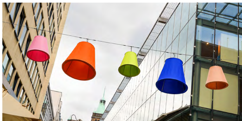
Seit Mittwoch verschönern die ersten Lampenschirme die Innenstadt.

Darüber hinaus eignet sich die Straße dann besonders in den Abendstunden als Fotomotiv in der Chemnitzer City. Das Projekt wird von zwei Unternehmen unterstützt und umgesetzt: zum einen von Höhenseiltechnik Seidler-Pelta, das für die Herstellung der Infrastruktur verantwortlich ist, und zum anderen von der MK Illumination Handels GmbH, die europaweit mit der Illumination öffentlicher Räume betraut sind. Die Maßnahme wird durch den Innenstadtfonds finanziert. Die Gesamtkos-