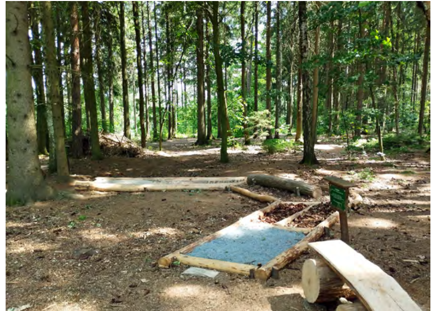
Auf dem Barfußpfad können Groß und Klein mit ihren Füßen verschiedene Untergründe erkunden.

Im Wildgatter Oberrabenstein sind außerdem weitere Jungtiere zur Welt ge-