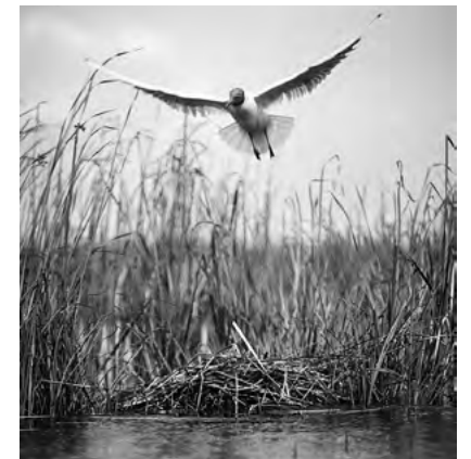
Schwarz-Weiß-Aufnahme: Lachmöwe zum Nest fliegend, Oberlausitz, um 1925/1930.

verschiedener Waldtiere vor. Als Tierfotograf trat Rudolf Zimmermann nach 1905 in Erscheinung. Zeitlebens nutzte er eine Plattenkamera, die Glasnegative im Mittelformat belichtete; mit dieser scheinbar unhandlichen Technik gelangen dem geduldigen Beobachter Momentaufnahmen, deren Qualität ihm zwischen den Weltkriegen internationale Beachtung einbrachte. Zimmermanns Bilder illustrierten neben eigenen Veröffentlichungen auch Fach- und Lehrbücher und wurden als Diapositiv-Lehrsätze für den Schulunterricht vielfältig. Die als Vorläufer der Deutschen Fotothek 1924 gegründete Landesbildstelle übernahm über 3.500 Negative aus Zimmermanns Nachlass.