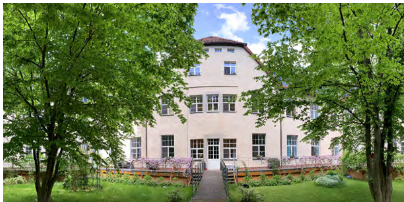
Das Zentrum für Palliativmedizin am Standort Küchwald bietet elf Betten in barrierefreien Zimmern.

In der Palliativmedizin werden Patientinnen und Patienten mit lebensbegrenzenden Erkrankungen in allen Phasen der Erkrankung und unabhängig von ihrer verbleibenden Lebenszeit behandelt. Bislang gab es am Klinikum eine Palliativstation sowie ein Palliativdienstteam, das schwerkranke Patientinnen und Patienten in den Fachkliniken aufsucht und mitbetreut. Bereits in diesem Jahr nimmt ein zweites Palliativdienstteam seine Arbeit auf. Weiterhin soll ein neues Behandlungskonzept eingeführt werden, das zunehmend Methoden der Komplementärmedizin in Ergänzung zur Schulmedizin einbezieht, um die ganzheitliche Versorgung von Palliativpatientinnen und -patienten zu verbessern. »Bei Palliativmedizin denken die meis-