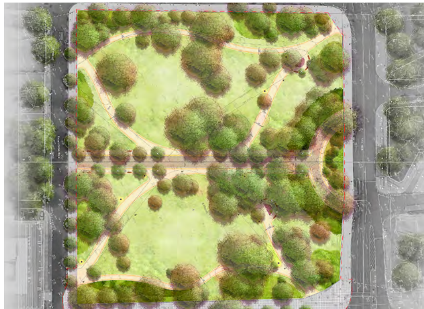
Mehr Grün, weniger geradlinig: Die Neugestaltung orientiert sich an der Ursprungsanlage aus den 1860er Jahren. Visualisierung: Neumann Gusenburger

Zentrales Anliegen der Umgestaltung ist, die Aufenthaltsqualität zu erhöhen. Heute wird der Park meist nur durchquert. Die künftige Wegführung orientiert sich deshalb wieder am historischen Wegenetz von 1910, die Wege werden weniger geradlinig durch den Park verlaufen, sondern in Schwüngen.