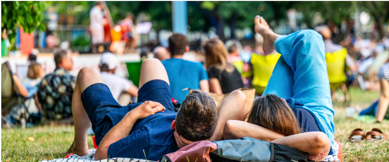
Die zahlreichen Konzerte luden zum entspannten Beisammensein am Abend ein.