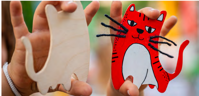
Auch für Kinder hatte der Parksommer allerlei Veranstaltungen zu bieten.

Dass die Gästezahl des Vorjahres (21.500 Besucherinnen und Besucher) geknackt werden würde, zeigte sich schon in den ersten beiden Wochen. Allein die ersten zehn Festivaltage lockten mehr als 14.000 Gäste an, den beiden Eröffnungsveranstaltungen mit dem Studio W.M. – Werkstatt für Musik und Theater – wohnten 5.000 Gäste bei. Auch die anderen Veranstaltungen waren gut besucht. Durchschnittlich 900 Besucherinnen und Besucher trafen sich bei den abendlichen Konzerten in entspannter Atmosphäre. Zu hören gab es u. a. Jazz, Blues und Folkmusik. Die Sonntagsreihe »Wunschkonzert«, bei der Künstlerinnen und Künstler aus den vergangenen Jahren auftraten, kam mit