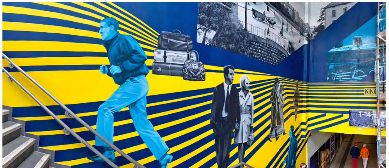
Zahlreiche neue Gesichter zieren nun die Fußgängerunterführung an der Dresdner Straße.