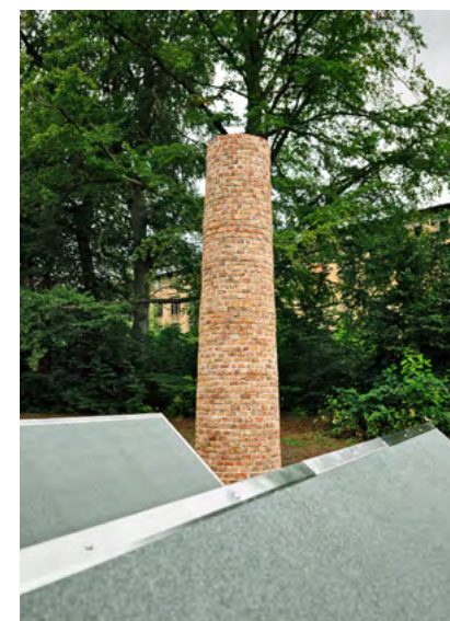
Die Skulptur »Ohne Titel (ESDA)« von Iskender Yediler wurde am Samstag in Lichtenstein eingeweiht.