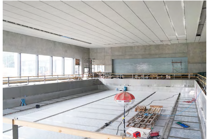
Die neue Schwimmhalle verfügt über ein 25-Meter-Becken und sechs Bahnen. Die Arbeiten sollen bis zum Beginn des kommenden Schuljahres abgeschlossen sein.

Die Kosten für den Neubau auf dem Gelände des Schwimmsportkomplexes liegen bei rund 24,6 Millionen Euro. Davon sind rund 13,2 Millionen Euro Fördermittel aus dem Programm »Brücken in die Zukunft« eingeplant. Der Chemnitzer Stadtrat hatte im Juni 2016 den Neubau einer wettkampfgerechten Schwimmhalle beschlossen. Der neue Schwimmsportkomplex am Standort des Freibades in Bernsdorf soll in erweitertem Umfang die Funktionen der ehemaligen Bernsdorfer Schwimmhalle ersetzen sowie den Standort des Bernsdorfer Freibades