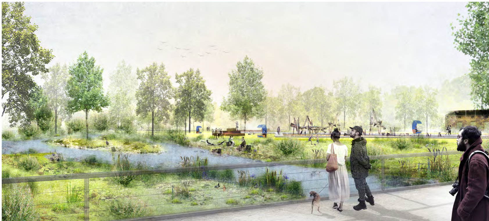
Blick von der Limbacher Straße: Der Pleißenbach wird seine Mauern verlieren und er wird im Anschluss verbreitert. Eine Fußgängerbrücke wird künftig die Stadtteile Altendorf und Kaßberg besser miteinander verbinden. Visualisierung: Station C23