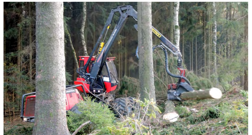
Während der Waldpflegearbeiten sind Waldflächen und -wege gesperrt.

Waldbesucher berücksichtigen bitte unbedingt, dass während der Dauer des Holzeinschlags Waldflächen und Waldwege aus Sicherheitsgründen für Passanten gesperrt sind (Sächs. Waldgesetz, § 11 Absatz 3). Es wird darauf hingewiesen, unbedingt auf Absperrungen zu achten. Holzpolter dürfen nicht betreten oder beklettert werden. Es