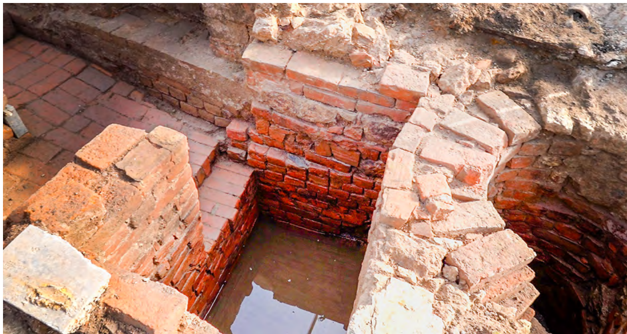
Eine Mikwe ist ein jüdisches Tauchbad, das für rituelle Waschungen zum Beispiel vor hohen Feiertagen verwendet wird.

Man hat das Gehäuse so gemacht, dass es nach unten offen ist. Das heißt