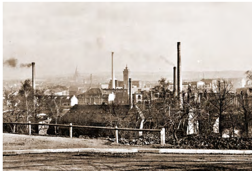
Chemnitzer Industrielandschaft: Das Foto zeigt den Blick vom Kapellenberg in Richtung Lutherviertel. Zwischen den Schornsteinen ist der Uhrturm von Schubert & Salzer deutlich erkennbar.