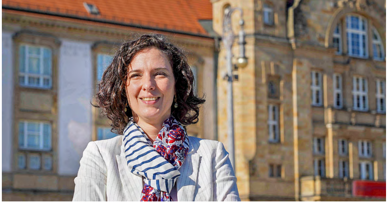
Die neue Generaldirektorin mit klarem Ziel: Fokus auf Einbindung der Menschen und Vernetzung mit der Region.