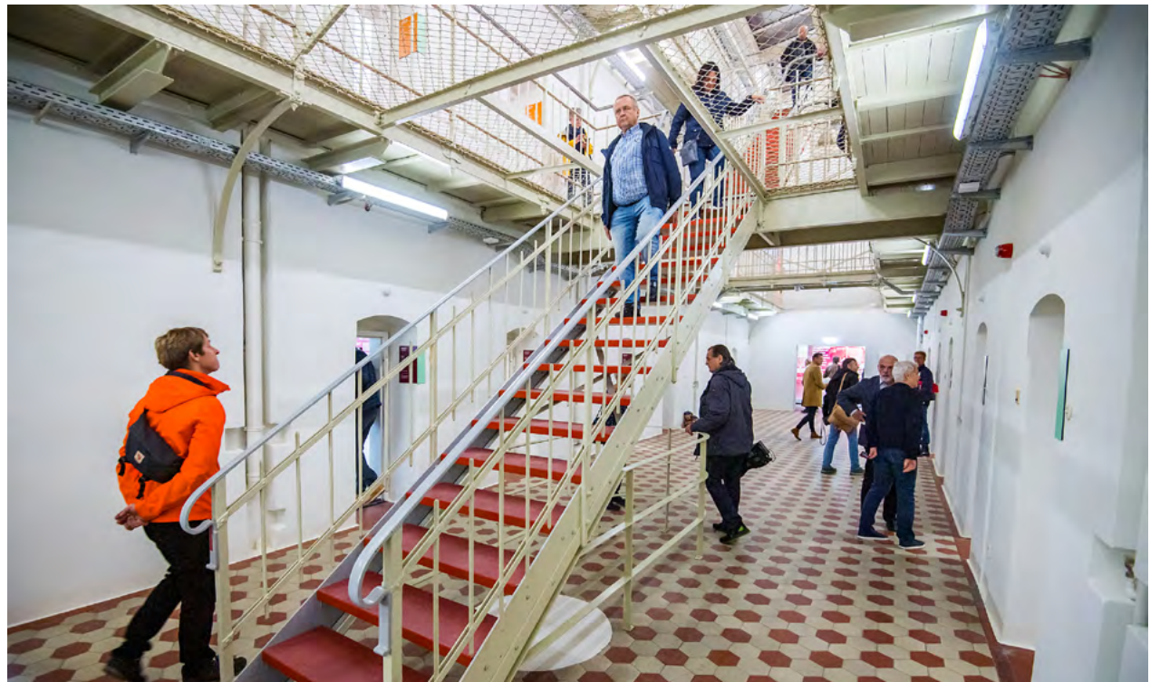
Zur Eröffnung am vergangenen Freitag konnten sich Medienschaffende sowie geladene Gäste bereits den neuen Lern- und Gedenkort anschauen.

»Wir haben einen langen, mühevollen Weg von der Vereinsgründung im November 2011 über den Gedenkort 2017 bis zur Eröffnung des Lernorts für Demokratie im Oktober 2023 zurückgelegt,« sagt Jürgen Renz, der Vorsitzende des Lern- und Gedenkort Kaßberg-Gefängnis e. V. »Wer sich auf diesen Ort einlässt, kann begreifen, wie wertvoll