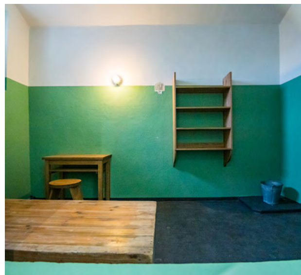
Der Verein Lern- und Gedenkort Kaßberg-Gefängnis e. V. hat drei Schauzellen mit originalen oder nach historischen Vorbildern gefertigten Gegenständen ausgestattet. Er zeigt die Zelleneinrichtung in der Zeit des Nationalsozialismus, in der Untersuchungshaft der Stasi und in der Freikaufhaft. Geöffnet ist der neue Lernort ab dem 28. Oktober immer mittwochs bis sonntags jeweils von 10 bis 17 Uhr.