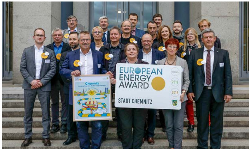
Im Jahr 2019 erhielt Chemnitz für die Nachhaltigkeit der Energie- und Klimaschutzpolitik den European Energy Award in Gold. Am 28. November wird dieses Engagement erneut gewürdigt. Das Amtsblatt berichtet in der nächsten Ausgabe darüber.