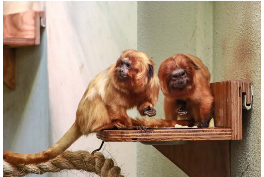
Die Goldgelben Löwenäffchen Stitch und Anja harmonieren gut miteinander. Im Idealfall kann sich der Tierpark Chemnitz über Nachwuchs dieser selten gewordenen Art freuen.

So lernten sich Anja und Stitch erstmal hinter den Kulissen kennen – auf neutralem Grund quasi. Weil Anja schon seit 2018 im Tierpark Chemnitz lebt, sieht sie ihr Gehege als ihr Revier an. Damit sie dort nicht zu dominant auftritt, wurde für die beiden ein anderes Gehege gewählt, wo die nötige Ruhe vorherrscht, um sich kennenzulernen. Mittlerweile teilen sich Anja und Stitch aber das Gehege im Krallenaffenhaus und sind für die Besucherinnen und Besucher zu sehen. Sie harmonieren gut miteinander, verbringen die Nächte oft zusammen in einer Schlafhöhle, gehen tagsüber aber auch mal ihrer Wege. Goldgelbe Löwenäffchen können in Gruppen von mehr als zehn Tieren zusammenleben. Angeführt werden sie von einem Weibchen, welches in der Regel ein erwachsenes Männchen an ihrer Seite duldet. Die anderen Mitglie-