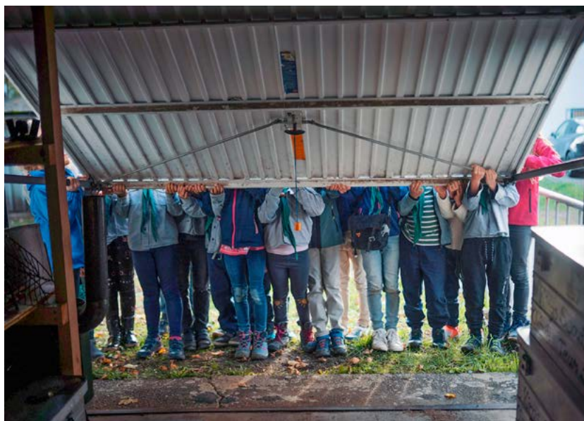
»#3000Garagen« heißt eines der Hauptprojekte für das Programm der Kulturhauptstadt Europas Chemnitz 2025.