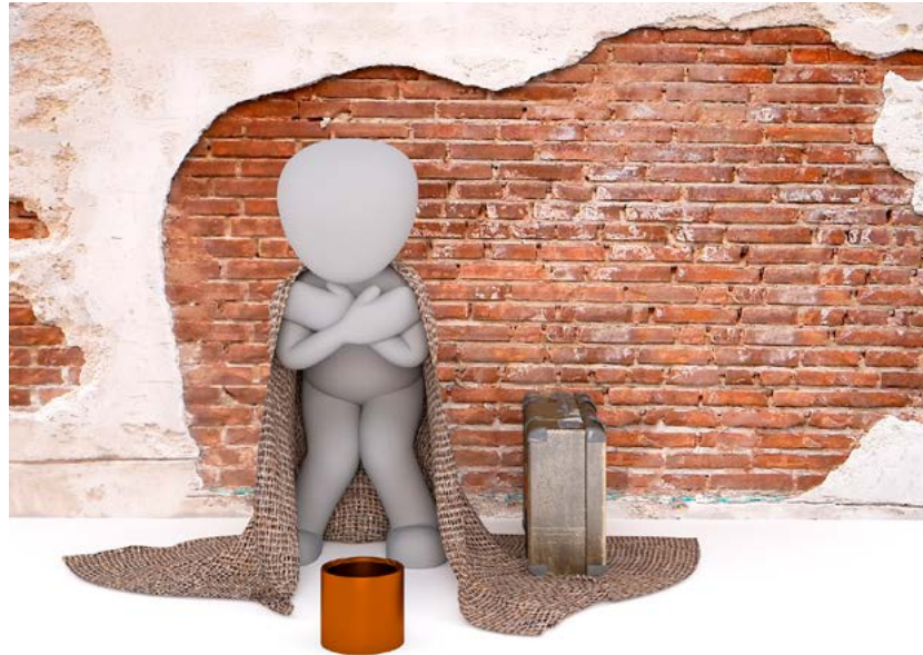
Das Sozialamt der Stadt Chemnitz und viele weitere gemeinnützige Organisationen bieten Wohnungslosen Hilfe und Unterbringung an.

Alle Angebote werden kontinuierlich und bedarfsorientiert vorgehalten. Bei