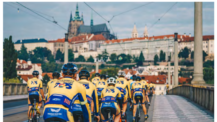
Der European Peace Ride führte die Teilnehmenden 2022 unter anderem nach Prag. Er ist eines der Hauptprojekte der Kulturhauptstadt.