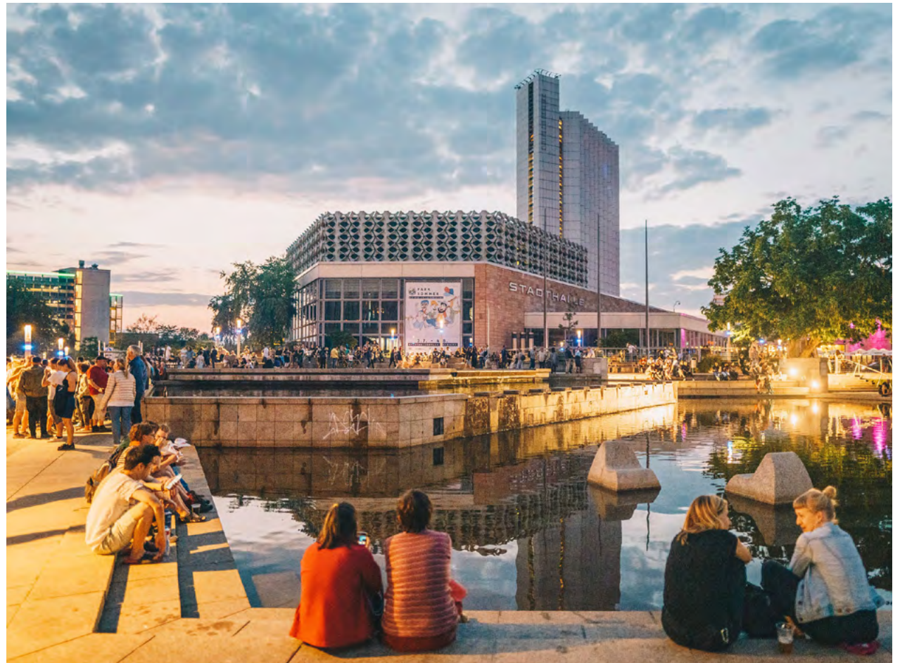
Viele Museen, die Theater, Vereine und Initiativen sowie die Chemnitzer Festivals werden das Kulturhauptstadtjahr zu einem besonderen für ganz Chemnitz und die Kulturregion machen.

Auch das Ausstellungsprojekt »European Realities« im Museum Gunzenhauser der Kunstsammlungen Chemnitz