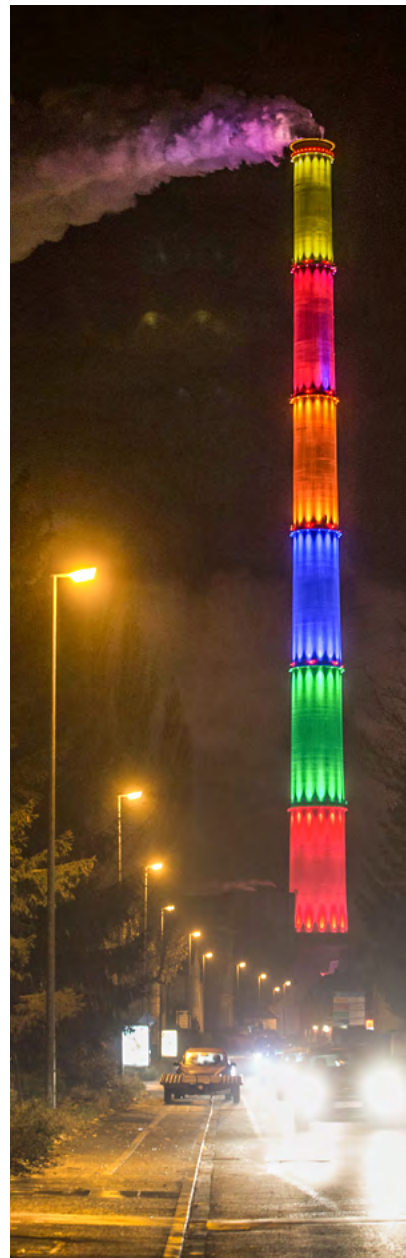
Seit 2013 ist der Schornstein bunt, seit 2017 beleuchtet und seitdem ist er ein Wahrzeichen der Stadt.

Das Unternehmen mit Sitz in Chemnitz versorgt rund 400.000 Haushalte und Gewerbekunden mit Erdgas, Strom, Internet, Wärme und Kälte sowie Wasser. Zudem kümmert sich eins um die Abwasserentsorgung in Chemnitz und Teilen des Umlandes. Mehrheitlich befindet sich eins in kommunaler Hand. Die Stadt Chemnitz und der Zweckverband »Gasversorgung in Südsachsen«, ein Zusammenschluss von 117 Städten und Gemeinden, sind mit 51 Prozent beteiligt. Die eins-Gruppe beschäftigt rund 1.300 Mitarbeitende. ■