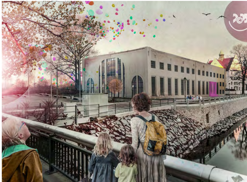
Die Hartmannfabrik wird das Besucherzentrum in 2025 und Sitz der Kulturhauptstadt Europas Chemnitz 2025 gGmbH sein. Grafik: Atelier N4

Vom 30. Mai bis zum 1. Juni 2025 verwandelt das Hutfestival – das erfolgreiche Chemnitzer Festival der Straßenkunst – die Innenstadt für drei Tage in eine große Freilichtbühne für