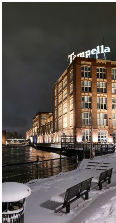
Der Namenszug der »Tampella«-Fabrik in Tampere erinnert an die Industriegeschichte der Stadt.

Der anschließende Besuch des Lenin Museums lieferte die Erklärung für den plötzlichen Niedergang der industriellen Produktion in Tampere nach 1990. Die finnische Wirtschaft war vor allem nach