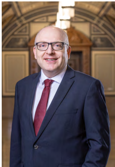
Oberbürgermeister Sven Schulze betont, dass die Kulturhauptstadt von den Menschen lebt, die sie mitgestalten.

Mit dem Titel Kulturhauptstadt Europas, der nur alle 15 Jahre nach Deutschland kommt, haben wir die einmalige Gelegenheit, uns als Stadt und Region, als Freistaat Sachsen, aber auch als Bun-