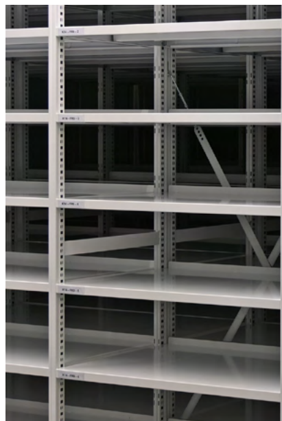
Blick hinter die Kulissen: Die neue Handkurbel-gesteuerte Regalanlage im Einsatz.