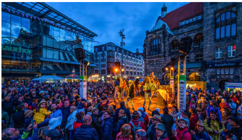
Das Hutfestival wird zu einem der Hauptveranstaltungen der Kulturhauptstadt Europas Chemnitz 2025. Foto: Kristin Schmidt