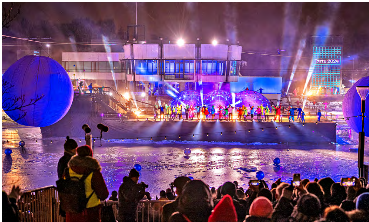
Die große Eröffnungsshow der Europäischen Kulturhauptstadt Tartu fand auf einer eigens angefertigten Bühne am zugefrorenen Fluss Emajõgi statt. Tausende Besucher feierten bei Minusgraden mit.

Die Chemnitzer Delegation besuchte die offizielle Eröffnungszeremonie in der Konzerthalle in Tartu. Geboten wurden dort kurzweilige Reden sowie traditionelle und moderne Musik. Weiter ging es zum großen Opening am Fluss Emajõgi in der Innenstadt. Den tausenden Besucherinnen und Besuchern wurde ein durchchoreografiertes, buntes Programm »All is One« mit anschließender Party am Estnischen Nationalmuseum geboten. Und auch die Region feierte am darauffolgenden Tag ihr Opening in Põlva mit einem mitreißenden Konzert der angesagten estnischen Ska-Band »Angus«.