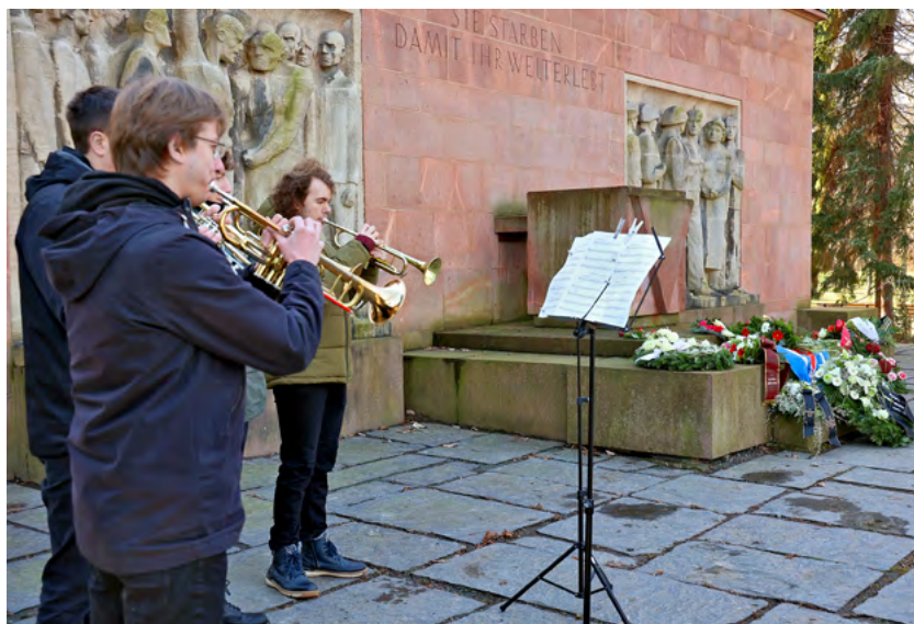
Am Mahnmal im Park der Opfer des Nationalsozialismus gedachten viele Menschen den Opfern dieser Gewaltherrschaft.