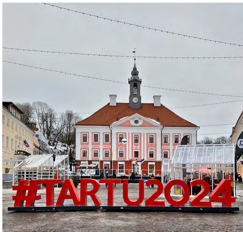
Auf dem Marktplatz vor dem Rathaus in Tartu steht ein großer Schriftzug – #TARTU2024 – der den Gästen aus dem In- und Ausland als beliebtes Fotomotiv dient. Die südestnische Stadt hat rund 90.000 Einwohnerinnen und Einwohner.