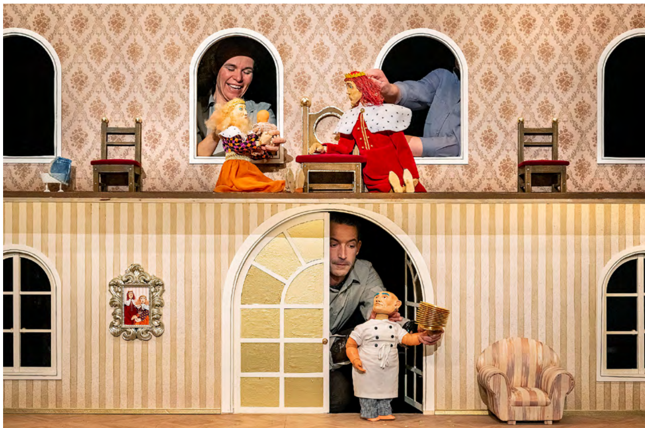
Das Figurentheater zeigt in den Winterferien »Dornröschen«.