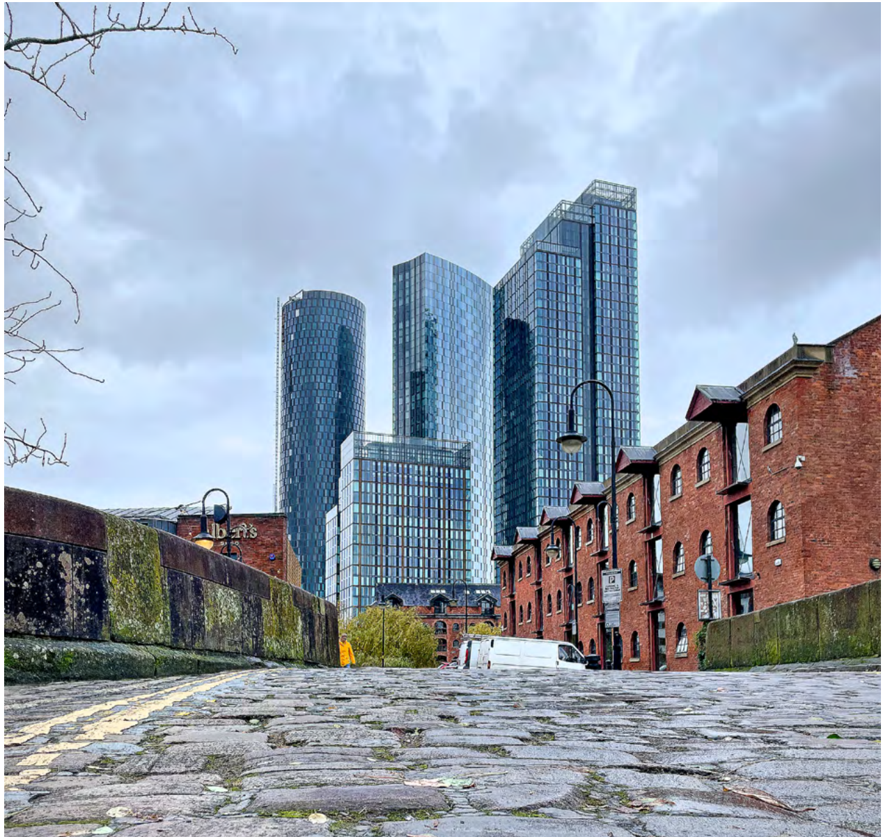
Altes und neues vereint: Blick von der Castle Street auf die Hochhäuser von Deansgate in Manchester.

Bereits 1797 kam es aufgrund der Hungerlöhne und schlechter Wohnbedingungen zu Aufständen unter den Arbeitern. Die Verhältnisse veranlassten Friedrich Engels 1845 »Die Lage der arbeitenden Klasse in England« zu ver-