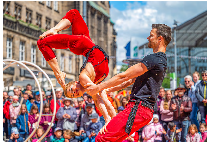
Beim Hutfestival zeigen Straßenkünstlerinnen und -künstler ein ganzes Wochenende lang ihr Können.

Akrobatisch wird es bei der Seiltanzshow vom Rope Theatre aus Köln. Das Schlappseil wird neben dem Roten Turm gespannt – das Areal um das älteste Wahrzeichen der Stadt wird erstmals als weitere Spielfläche ins Festival integriert. Die musikalische Unterhaltung kommt in diesem Jahr unter an-