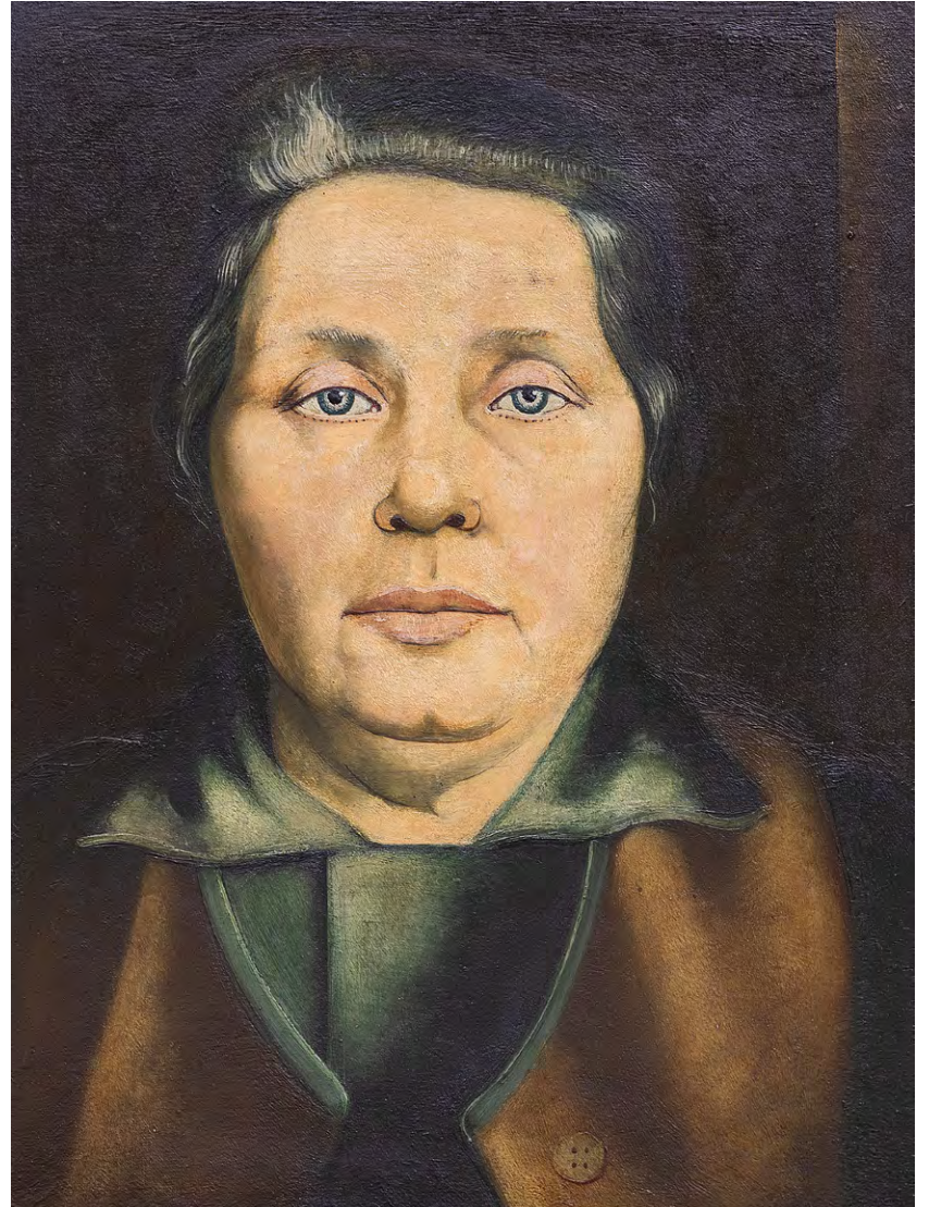
Ernst Thoms: Meine Mutter, 1928; Museum Nienburg/Weser.

Die Ausstellung nimmt den Kerngedanken des Diskurses zur Zeit der Weimarer Republik in den Fokus und betrachtet ihn kritisch. Heute wird dieses Denken häufig als Kategorisierungs- und Typisierungswahn einer orientierungssuchenden Epoche bewertet. Jedoch kann schnell festgestellt werden, dass viele Stereotype und Klischees von damals bis in die Gegenwart nachwirken und weiter-