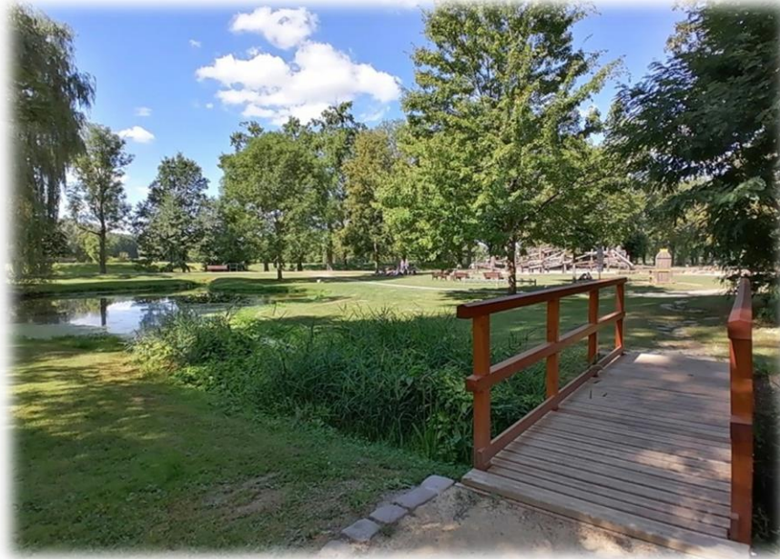
Teich mit anliegendem Spielplatz