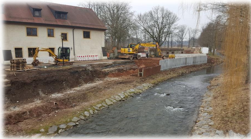
Um das Schloss herum entsteht der neue Schutzwall aus massiven Betonwänden.