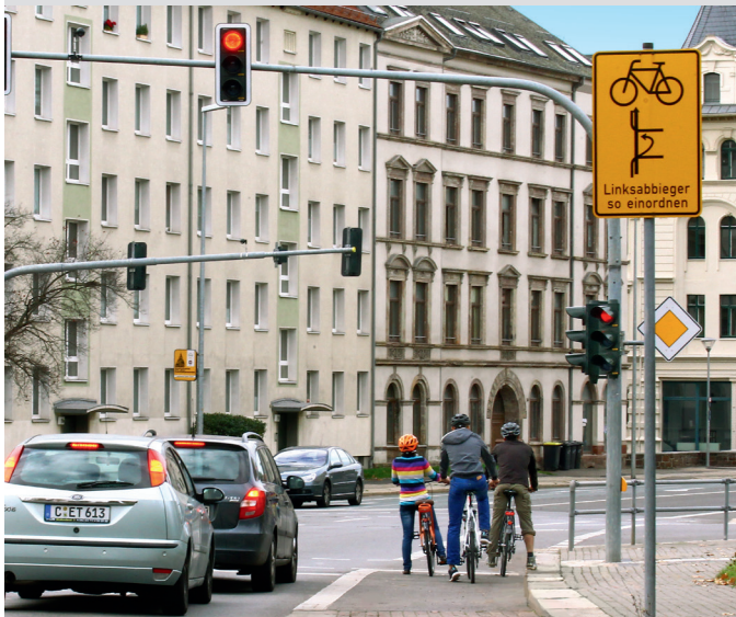
Indirektes Linksabbiegen Zschopauer Straße in die Lutherstraße